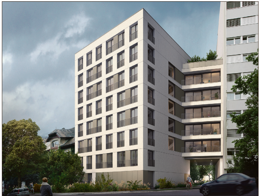
Une intégration parfaite dans le paysage.